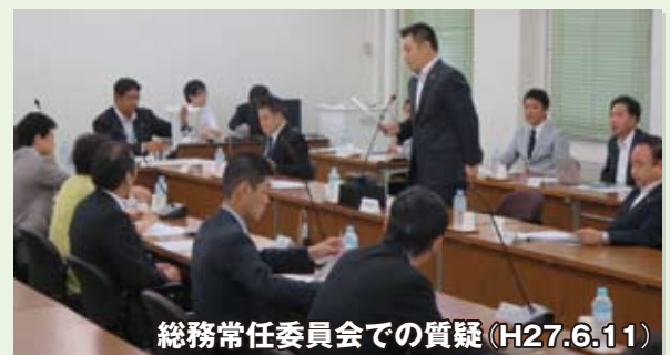
総務常任委員会での質疑 (H27.6.11)

大阪の広域課題を府と大阪、堺両市の首長と議員が協議し、二重行政の解消を目指す「大阪会議」条例案が自民党から提出されましたが、一部条項に違法性が指摘されるなど内容的に問題の多い議案でした。