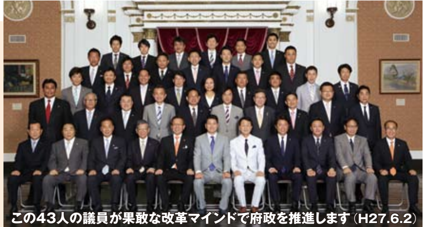
この43人の議員が果敢な改革マインドで府政を推進します (H27.6.2)

府民の皆様の熱いご期待に応えるべく、この4年も、大阪を再生し魅力と活力を生み出すための大都市制度改革をはじめ、公務員改革、教育改革、議会改革など大胆な府政改革を、納税者目線と果敢な改革マインドで断行し、大阪から日本の新しい時代を切り拓いてまいります。