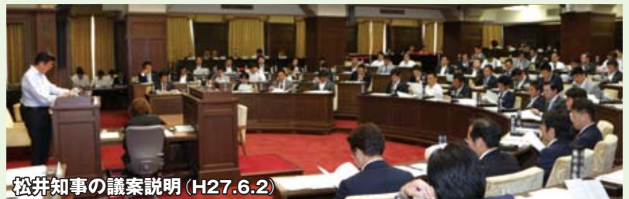
松井知事の議案説明 (H27.6.2)