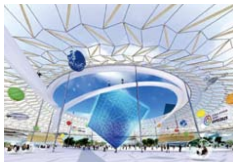
「空」と呼ばれる屋根付きの大広場のイメージ図

会場中心部にパビリオン等、南側水面に水上施設等、西側緑地にアウトドア施設等をそれぞれ整備