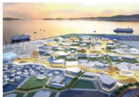
南西側を望む夕景の会場鳥瞰図

AR (拡張現実)・MR (複合現実) 技術を活用した展示やイベントなどを行い、来場者の交流の場とする