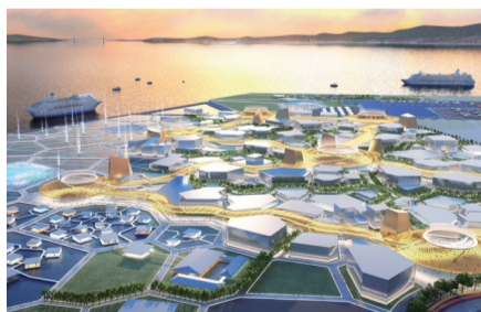
南西側を望む夕景の会場鳥瞰図。

AR(拡張現実)・MR(複合現実)技術を活用した展示やイベントなどを行い、来場者の交流の場とする。