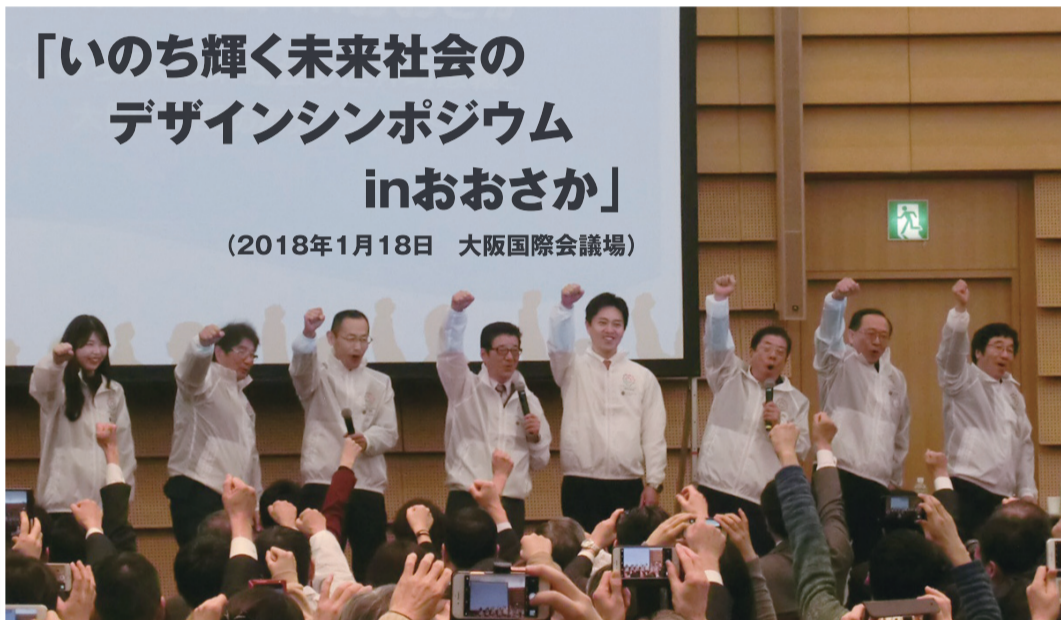
「いのち輝く未来社会の デザインシンポジウム inおおさか」 (2018年1月18日 大阪国際会議場)