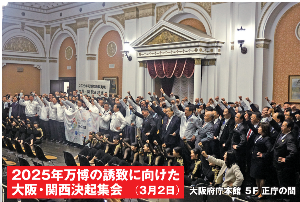
2025年万博の誘致に向けた大阪・関西決起集会 (3月2日) 大阪府庁本館 5F 正庁の間