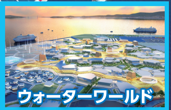
ウォーターワールド