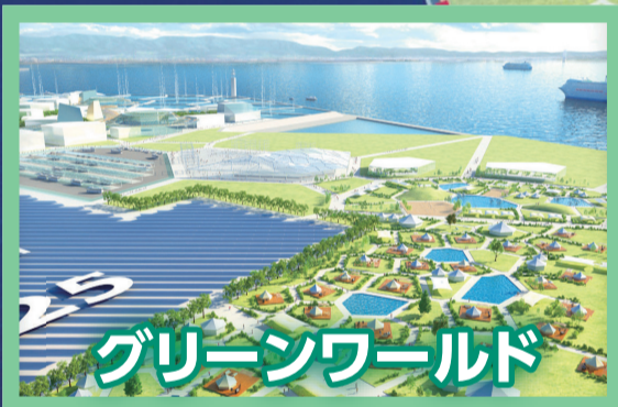
グリーンワールド